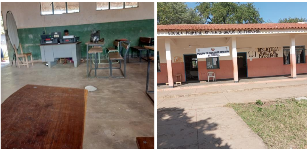
Imagem de postos de recenseamento em Massingir - Gaza

Segundo alguns supervisores, nos recenseamentos passados, a estas alturas do fim do recenseamento os eleitores fluíam em massa e formavam-se longas filas.